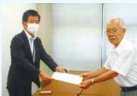
総務省への要望書提出