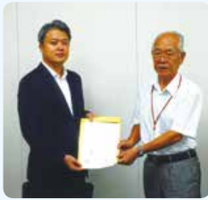
文部科学省への 要望書提出