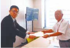
厚生労働省への要望書提出