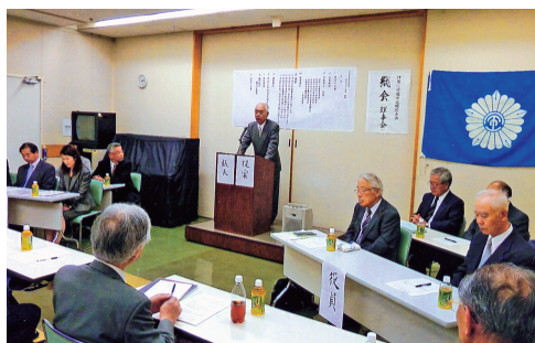
平成22年度「総会」 青少年育成センター